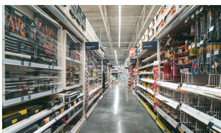
WINKELS EN RETAILKETENS