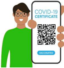
Kunde oder Mitarbeiter