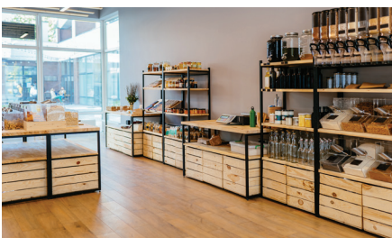
WINKELS- EN KLEINE RETAILKETENS