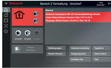
Anlage zeigt Einbruchsversuch an Um 4:18 Uhr wurde ein Alarm ausgelöst.