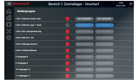
Übersicht Meldergruppen Meldergruppen anzeigen und sperren möglich.