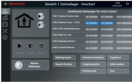
Anlage kann nicht scharf geschaltet werden Übersichtliche und klare Informationen, die das Scharfschalten verhindern.

Ab sofort lassen sich mit dem neuen MB TouchScreen Bedienteil so intuitiv und komfortabel wie nie zuvor die Zentralen-Baureihen MB-Secure und MB-12/24/48/100/256 plus bedienen. Mit dem hochwertigen kapazitiven Display und dem im Trend liegenden Kacheldesign lassen sich per Fingertipp und mit Wischgesten die komplette Einbruchmeldeanlage steuern. Das neue grafische Interface bietet Ihnen als Anwender eine einfache und anschauliche Bedienung sämtlicher Funktionen, Meldungen und Zustandsanzeigen.